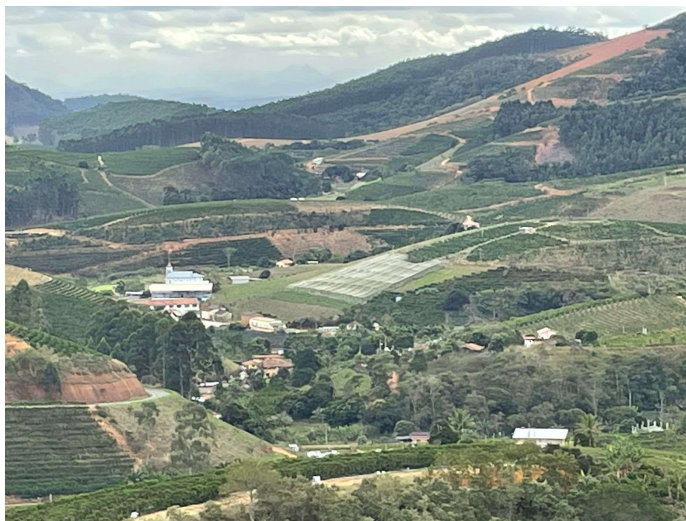
Imagem 1: Comunidade Vale de Tabocas - Santa Teresa/ES

Segue algumas imagens presentes no documentário.