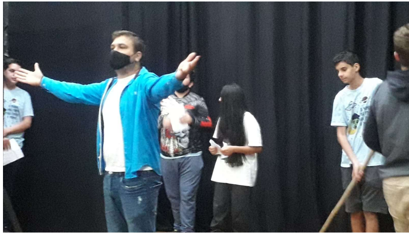
Imagem 3: desenvolvimento do projeto