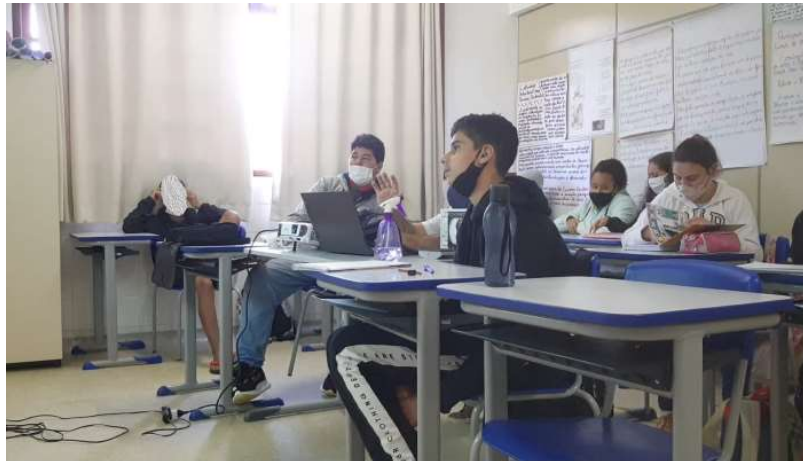
Imagem 7: desenvolvimento do projeto